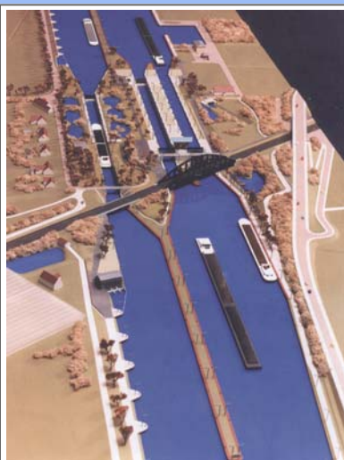
Modell der neuen Schleusengruppe Münster

Aufgrund des Alters der heutigen Schleusen und der gestiegenen Anforderungen aus der Schifffahrt wurde der Bau von neuen Schleusen in Münster erforderlich.