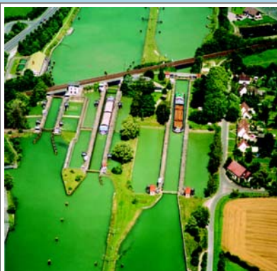
Luftbild der alten Schleusengruppe Münster