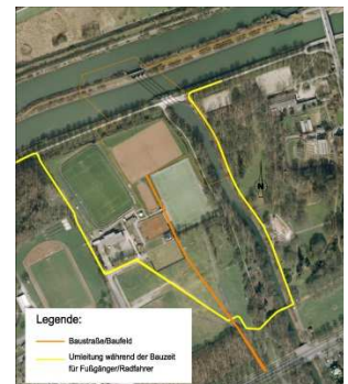
Umleitung während der Bauzeit