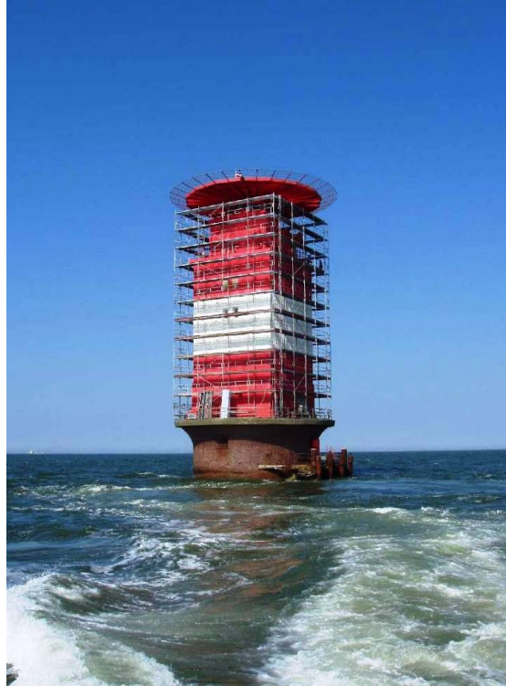
Eigerüsteter Leuchtturm Mellumplate mit oben zu erkennendem alten Fangnetz des Hubschrauberlandedecks

Dieses Blech (in der entsprechenden Farbe) wurde den Anforderungen auf See entsprechend stabil ausgeführt und befestigt. Unglücklicherweise brachte bereits ein Jahr nach Fertigstellung ein außergewöhnlicher Seeschlag der Nordwestseite des Turms einen erheblichen Schaden bis zu einer Höhe von 5 Metern. Dieser wurde sofort repariert und seitdem blieb der Turm ohne größere Schäden durch Wind und Wetter, so dass sich die neue Außenhautkonstruktion dann doch als effizient erwies.