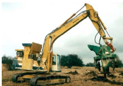
Abb. 5 „Rotree“-Bodenmeliorationsgerät

Die Elbübersetzstellen wurden Jahrzehnte lang von den sowjetischen Streitkräften intensiv mit Ketten- und Radfahrzeugen befahren, um das Übersetzen mittels Pontonbrücken bzw. Tiefwaten zu üben. Dieses hatte zur Folge, dass die sensiblen Lehm- und Tonböden extrem verdichtet waren und mit konventioneller Technik nicht für das Bepflanzungsvorhaben aufgelockert werden konnten. Vom Bundesforstamt Möser wurde aufgrund der Bodenbesonderheit das „Rotree“-Bodenmeliorationsaggregat der Firma NFT eingesetzt. Es handelt sich dabei um einen großen Bagger, an dessen Arm sich ein drehendes, massiges und stabiles Meliorationsaggregat befindet. Zunächst wird mit einem daran befestigten Reisigrechen der Grasfilz abgezogen und anschließend wird der Boden in einem Durchmesser von 1,20 m und einer Tiefe von 1,00 m durch langsame Drehbewegungen aufgelockert. Gleichzeitig wurde optional eine Magnesium-Kalk-Zugabe von 6 kg pro Pflanzloch durchmischt. Die Pflanzen finden in diesem aufgelockerten Pflanzplatz optimale Wuchsbedingungen vor und können ungehindert ihre Wurzeln ausbreiten. Eine „Topfwirkung“ durch Verdichtung der Bohrlochränder besteht bei diesem Verfahren nicht. Dieses aufwändige Gerät wird in Australien gebaut und wurde für