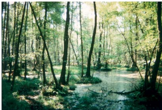
Abb. 1a Aus natürlichen, wasserregulierenden Auenwäldern...

Als Auenwälder werden solche Waldgesellschaften bezeichnet, die mindestens im Abstand von mehreren Jahren durch Hochwasser überschwemmt werden. Durch die periodischen Überflutungen werden im reichen Maße Nährstoffe zugeführt, die die ohnehin meist fruchtbaren Böden ständig anreichern und damit günstige Lebensbedingungen für eine artenreiche Flora und Fauna schaffen. Allerdings stellt der tiefgreifende Wechsel zwischen einem Übermaß an Feuchtigkeit bei Überschwemmungen und einem Mangel an Wasser bei geringer Wasserführung des Flusses große Anforderungen an die Anpassungsfähigkeit der Pflanzenarten. Ebenso begrenzen langanhaltende Überflutungen und Treibeis das hier lebensfähige Artenspektrum.