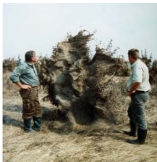
Abb. 7 Äußerst bizarre „Lehmstrauchplastiken“ im Jahrhunderthochwasser