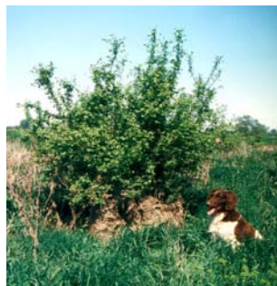
Abb. 8 Viele Bäume und Sträucher treiben nach dem Hochwasser wieder aus

Seit Beginn der Aufforstungen im Jahr 1997 mussten die künstlich angelegten Auenwälder typische Extremsituationen wie wochenlang anhaltendes Hochwasser, Eisgang aber auch extreme Trockenheit überstehen. Die hohen Anwuchsprozente und das mittlerweile üppige Wachstum der Bäume und Sträucher zeigt jedoch, dass das ausgewählte Artenspektrum standortangepasst ist und eine gute Grundlage für künftige ausgedehnte Auenwaldkulturen darstellt.