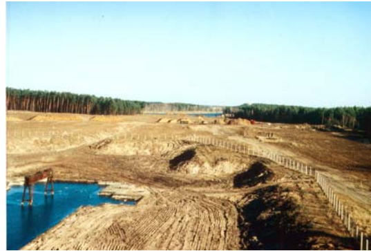
Abb. 2 Waldrodung für den Schleusenbau

Die großen Bauprojekte stellen nach dem Naturschutzgesetz Eingriffe in die Natur und Landschaft dar. In den jeweiligen landschaftspflegerischen Begleitplänen werden die erheblichen Beeinträchtigungen erfasst und die zu ihrer Kompensation erforderlichen Ausgleichs- und Ersatzmaßnahmen dargelegt und bilanziert. Um der Vielfalt der Eingriffe gerecht zu werden, wurde eine sehr differenzierte standort- und raumbezogene Ausgleichs- und Ersatzplanung erstellt.