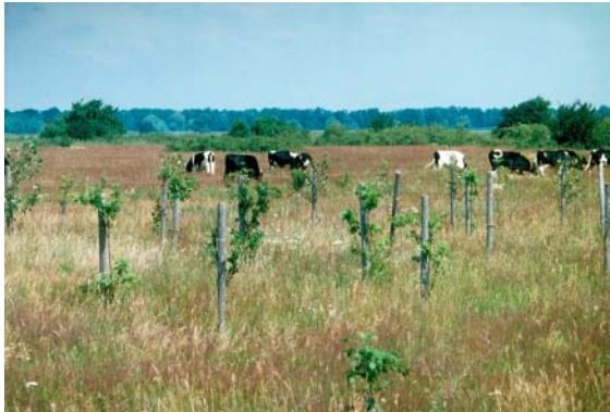
Abb. 4a Als charakteristisches Naturschauspiel werden die Auenwoldaufforstungen...

der Nähe von Siedlungsflächen) sicherzustellen, ist es ratsam, den durch die Pflanzungen im Strömungsbereich ggf. verursachten Rückstau durch ein Strömungsmodell zu untersuchen, wie dies derzeit vom Wasserstraßen-Neubauamt Magdeburg getan wird.