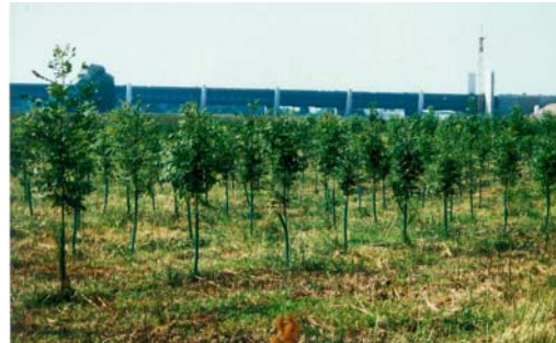
Abb. 6 Auenbepflanzungen unterhalb der beeindruckenden Kanalbrücke

Die Bepflanzung nicht verdichteter Wiesen gestaltete sich relativ unproblematisch. Nach einer streifenweisen Bodenbearbeitung (ca. 30 cm breit und 30-40 cm tief) wurden die Bäume und Sträucher in einem Reihenabstand von 2 – 3 m gepflanzt. Trotz üppigen Wachstums der Kraut- und Grasvegetation mussten die Kulturen nur auf wenigen Teilflächen freigeschnitten werden, um eine Verdämmung zu vermeiden.