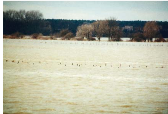
Abb. 4b ... mehrmals jährlich bisweilen meterhoch überflutet