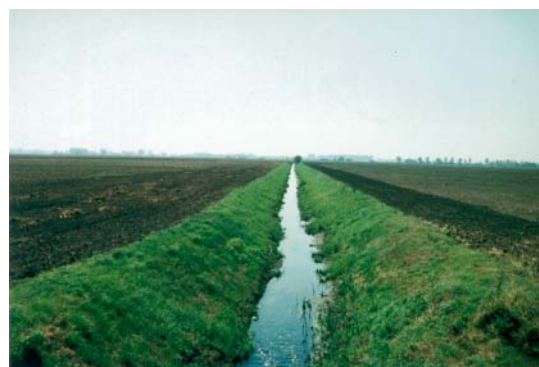
Abb. 1b ... wurden über Jahrhunderte artenarme landwirtschaftliche Intensivflächen

Frühzeitig erkannten schon die ersten Siedler den nachhaltigen Nährstoffreichtum der Standorte. So wurden die zuwachsstarken Auenwälder entlang der Elbe bereits vor Jahrhunderten durch selektive Holzentnahme genutzt. Vor allem verbleibende großkronige Eichen schafften eine gute Voraussetzung für die Hutebeweidung. Im Laufe der letzten 200 Jahre wurden die Bestände soweit aufgelichtet, dass die Huteflächen in