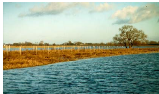
Abb. 3 Flutrinnen werden aus Hochwasserschutzgründen nicht bepflanzt

Aus Hochwasserschutzgründen sind enge deichbegrenzte Flussstrecken nicht für Aufforstungen geeignet, da sie langfristig den Wasserabfluss behindern und zu einem Rückstau führen könnten. Aus diesen Gründen muss auch auf ein Zäunen der Flächen verzichtet werden. Ferner ist zu beachten, dass gemäß Deichordnung bei der Bepflanzung ein Mindestabstand von 10 m vom Damm einzuhalten ist. Die Anpflanzungen haben auf den etwas höher gelegenen Flächen zu erfolgen; Kolke, Senken und Abflussrinnen müssen zur Gewährleistung des Hochwasserabflusses freigehalten werden. Es ist darauf zu achten, dass durch die Aufforstungsmaßnahmen keine Retentionsflächen verloren gehen. Pflanzmaßnahmen in Verbindung mit Maßnahmen an Altarmen oder die Schaffung von Senken können nicht nur erheblich zur Vielfalt des Lebensraumes „Auenwald“ beitragen. Bei fachgerechter Planung unter Berücksichtigung des Hochwasserabflusses kann durch Auwälder auch die Wasseraufnahmefähigkeit der Überflutungsflächen erhöht werden. Eine (so planvoll gestaltete) Rückhaltung des Wassers in Überschwemmungsgebieten trägt zur Dämpfung von Hochwasserspitzen bei. Um die Hochwasserunbedenklichkeit in kritischen Bereichen (z.B. in